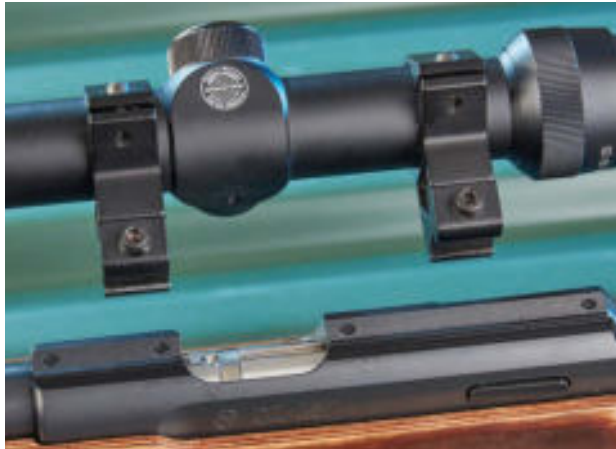
Der tschechische Hersteller Ceska Zbrojovka setzt bei seinem Repetierer 457 ganz klassisch auf eine 11-mm-Prismenschiene auf dem Systemgehäuse.