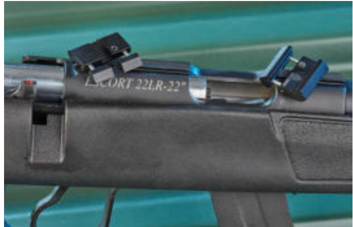
Auch die Leader Escort kommt mit Prismenschiene. Diese ließe sich durch die zwei aufschraubbaren UTG-Basen zum System Picatinny konvertieren.

oftmals die beste Lösung. Denn der Leuchtpunkt ist gut wahrnehmbar und das Auge muss sich nur daran versuchen, zwei Punkte in Form von Absehen und Ziel scharf zu sehen und nicht drei wie bei einer Waffe mit Kanne und Korn. Traditionell bieten Red Dots keine Vergrößerung und sie sind weitgehend un-