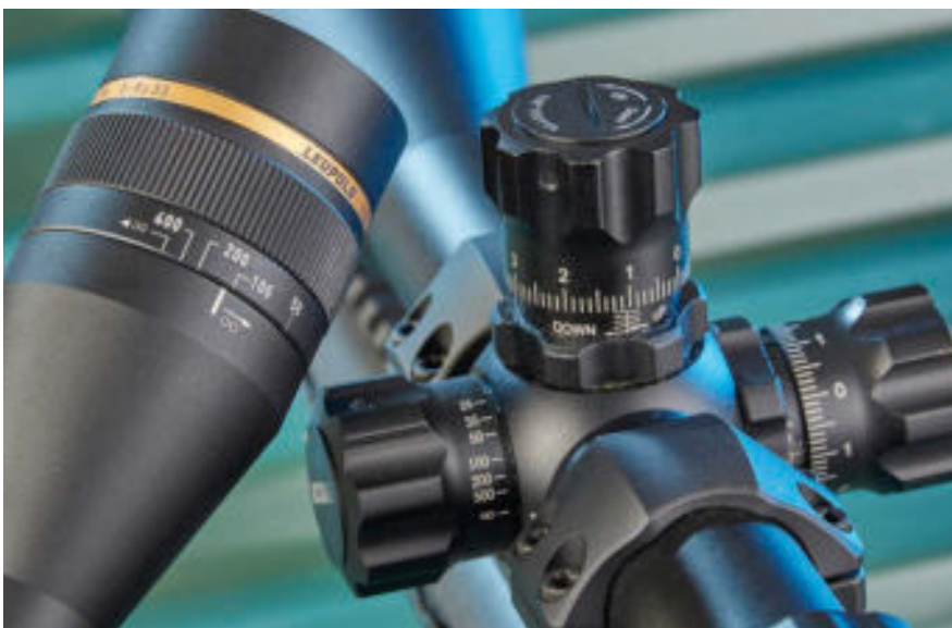
Nützlich für das Schießen auf unterschiedliche Distanzen: die Parallaxeverstellung. Bei dem Leupold VX-Freedom 3 – 9 x 33 (links) geht das über die Verstellung am Objektiv, bei dem UTG Accushot über den linken Stellturm am Mittelrohr.

wenn man schräg durch das Zielfernrohr blickt und es so zu einem Versatz zwischen dem Auge und der geraden Linie zwischen Zielfernrohr und Ziel kommt. Ab Werk sind Zielfernrohre auf eine feste Entfernung Parallaxe-frei justiert, hier macht dann der schräge Einblick in die Optik nichts aus. Welche Distanz genau, hängt vom Hersteller des ZF und dem angedachten Einsatzzweck ab. Das können für ein gängiges Zielfernrohr oftmals 100 Meter oder 150 Yards (137 m) sein, für ein KK-Zielfernrohr aber auch 75 Yards (68,5 m). Abhilfe schaffen bei Modellen mit Parallaxe-Ausgleich verschiebbare Linsen. Das kann über einen Stellturm am Mittelrohr erfolgen („side focus“), oder über einen Stellring am Objektiv („adjustable objective“). Wer auf unterschiedliche Distanzen seine Treffer schnell ins Ziel bringen will, ohne an der Absehenverstellung zu kurbeln, für den haben Hersteller wie etwa Burris, Bushnell oder Nikon haben aber auch spezielle Rimfire-Zielfernrohre im Programm. Deren Absehen sind mit Distanzmarken ausgestattet, üblicherweise ausgelegt auf die .22 l.r..